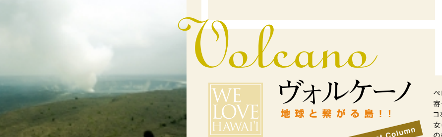
Power Spot Column