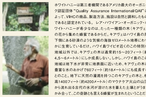
ホワイトハニーは第三者機関であるアメリカ最大のオーガニック認証団体"Quality Assurance International(QAI)"によって、VIHCの商品。製造方法・施設は自然と調和したものであると認定されている。レア・ハワイアン・オーガニック・ホワイトハニーが希少なものは、たった一種類の木(キアヴェ)の花から集めた蜂蜜であるからだ。キアヴェはハワイ島の風下にある砂漠のような乾燥の海岸セメント地帯にわずかに生育しているだけ。ハワイ島ワイピオ近くのこの特別な地域以外では、キアヴェの木は高約15~20フィート(約4.5~6メートル)に成長しない。しかし、ハワイ島のこの地域は地下水が非常に地表に近い。キアヴェの木は豊富な水のおかげで60フィート(約18メートル)にも成長する。このように天然の灌漑を持つこのキアヴェの木と、標高1400フィート(約420メートル)のマウナケア火山の山頂から流れ出る古代の氷が溶けた水を蓄えた土壌とがうまくかみ合っ、この奇跡ともいえる蜂蜜が生まれたというのだ。