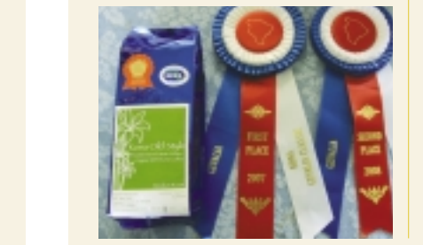
現地では8oz 18ドル、いい値段です。コンパクトではおっとだけ手数料をいただく3,000円で販売中